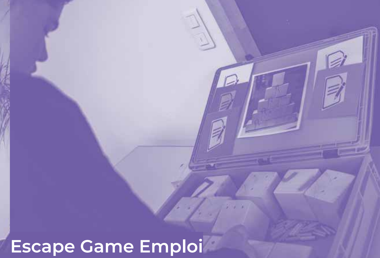
Escape Game Emploi